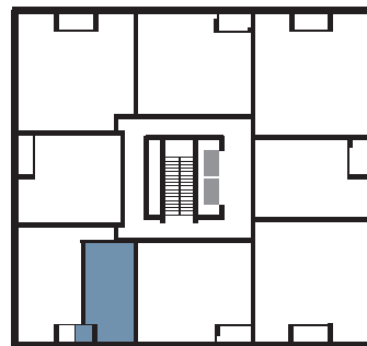
PLAN DU NIVEAU | FLOOR PLAN

BUREAU DES VENTES | SALES OFFICE : 303, boulevard Saint-Joseph, Lachine QC vncanal.com | 514.634.5353