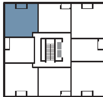
PLAN DU NIVEAU | FLOOR PLAN

BUREAU DES VENTES | SALES OFFICE : 303, boulevard Saint-Joseph, Lachine QC vncanal.com | 514.634.5353