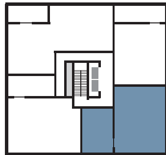
PLAN DU NIVEAU | FLOOR PLAN

BUREAU DES VENTES | SALES OFFICE : 303, boulevard Saint-Joseph, Lachine QC vncanal.com | 514.634.5353