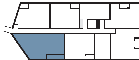
PLAN DU NIVEAU | FLOOR PLAN

Les tours A et B sont reliées par des passerelles. L'accès aux ascenseurs de la tour B est situé dans la tour A. Towers A and B are linked by a skywalk. Access to the tower B elevators is located in tower A.