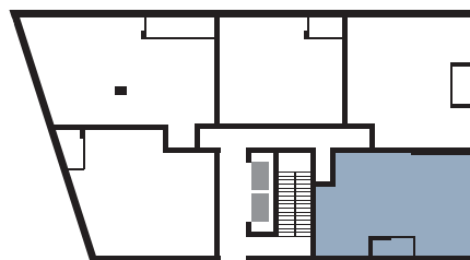
PLAN DU NIVEAU | FLOOR PLAN

BUREAU DES VENTES | SALES OFFICE : 303, boulevard Saint-Joseph, Lachine QC vncanal.com | 514.634.5353