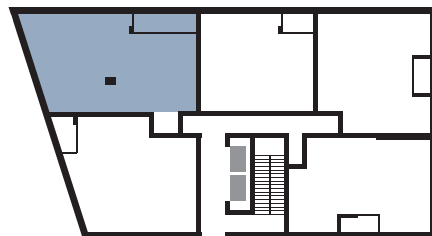
PLAN DU NIVEAU | FLOOR PLAN

BUREAU DES VENTES | SALES OFFICE : 303, boulevard Saint-Joseph, Lachine QC vncanal.com | 514.634.5353