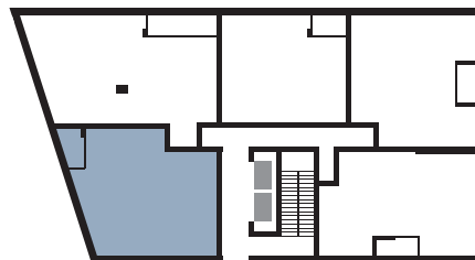
PLAN DU NIVEAU | FLOOR PLAN

BUREAU DES VENTES | SALES OFFICE : 303, boulevard Saint-Joseph, Lachine QC vncanal.com | 514.634.5353